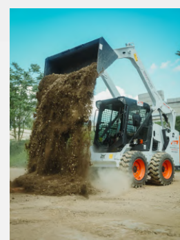
Smykový nakladač UNC

NIŽŠÍ CENA pokud nakládáte do našich kontejnerů, zaplatíte méně!