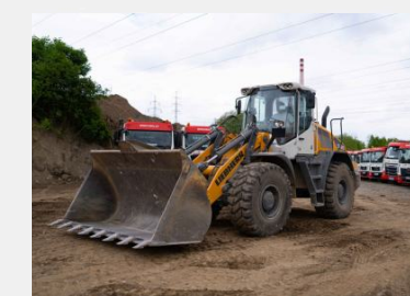
Kolový nakladač Liebherr L550