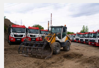
Kolový nakladač Liebherr L508 C